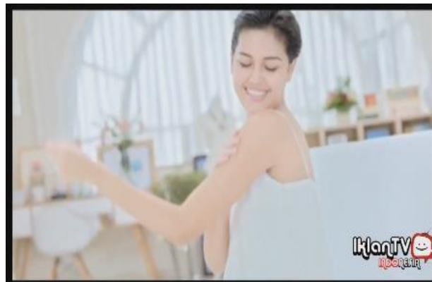
Gambar 5. Kamar modern minimalis (Biore, menit 00:14)

Tampilan elegan tersebut juga dikonstruksikan melalui latar tempat. Iklan Biore mengambil tempat di sebuah trotoar penuh dengan bunga, sebuah kamar bergaya modern-minimalis, dan sebuah ruang terbuka yang ditata menyerupai pesta kebun. Secara umum, latar tempat ditata secara sederhana dan modern. Meskipun demikian, sentuhan mewah dan klasik dihadirkan melalui bentuk bangunan bergaya Eropa di sepanjang tepi jalan, sebagaimana tampak dalam gambar berikut: