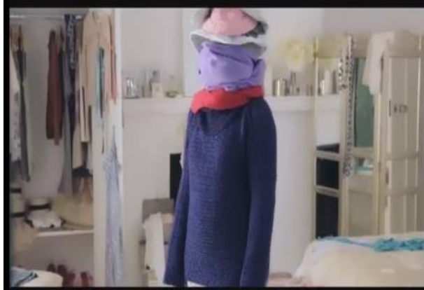
Gambar 9. Kecemasan tokoh dengan kulit kusam (Dove, menit 00:04)

Dalam iklan Dove Body Lotion, kecemasan yang diakibatkan oleh kulit kusam tampak lebih ekstrem. Para tokoh melakukan berbagai upaya untuk menutupi kulitnya, bahkan dengan cara yang konyol seperti tampak dalam screenshot berikut: