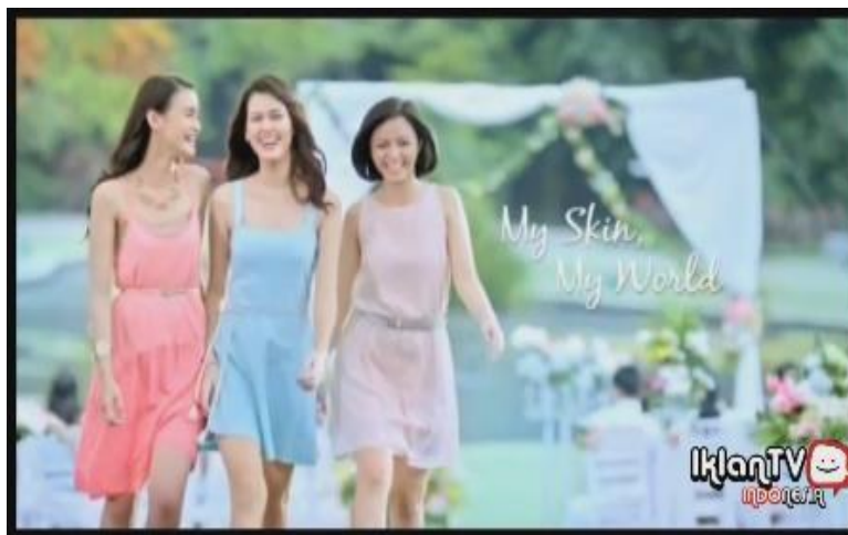
Gambar 11. Tokoh tampak gembira (Biore, menit 00.26)

Berbagai permasalahan kulit tersebut selanjutnya diatasi oleh produk-produk yang diiklankan. Penggunaan produk Biore pada akhirnya mampu mengembalikan sinar kulit si tokoh seperti sediakala. Pada akhir cerita digambarkan bagaimana si tokoh mendapatkan kembali rasa percaya dirinya. Ia tampak gembira berjalan bersama teman-temannya meski berada di ruang terbuka, sebagaimana tampak pada screenshot berikut: