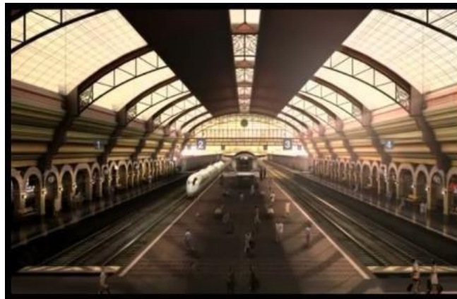
Gambar 7. Stasiun kereta api cepat (Pond's, menit 00:00)

Kesan elegan dan modern bergaya Eropa dikonstruksikan juga melalui latar tempat dalam iklan Pond's, yaitu sebuah stasiun kereta api super cepat. Jenis alat transportasi tersebut serupa dengan TGV ( train à grande vitesse ) di Prancis yang telah dioperasikan selama tiga dekade terakhir, dengan kecanggihan teknologi serta tingkat kecepatan tertinggi mencapai 320km/jam ( http://www.sncf.com/en/trains/tgv ). Adapun bangunan stasiun itu sendiri justru memberikan kesan klasik melalui bentuk lengkung pada pintu yang berderet serta nuansa warna kecoklatan yang melingkupi seluruh gedung.