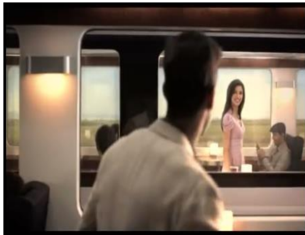
Gambar 13. Tokoh bertemu pasangan hidupnya di dalam kereta (Pond's, menit 00:22)

Dampak lebih jauh lagi ditampilkan oleh iklan produk Pond's. Berkat wajah yang putih bersih, tokoh tidak hanya memiliki rasa percaya diri. Namun lebih dari itu, kecantikan kulit wajahnya menarik perhatian lawan jenis hingga mempertemukannya dengan pasangan hidupnya, seperti tampak dalam screenshot berikut: