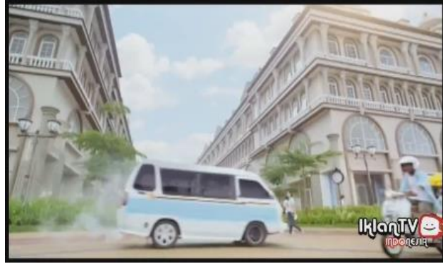
Gambar 6. Gedung bergaya arsitektur Eropa klasik (Biore, menit 00:00)

Kesan elegan dan modern bergaya Eropa dikonstruksikan juga melalui latar tempat dalam iklan Pond's, yaitu sebuah stasiun kereta api super cepat. Jenis alat transportasi tersebut serupa dengan TGV ( train à grande vitesse ) di Prancis yang telah dioperasikan selama tiga dekade terakhir, dengan kecanggihan teknologi serta tingkat kecepatan tertinggi mencapai 320km/jam ( http://www.sncf.com/en/trains/tgv ). Adapun bangunan stasiun itu sendiri justru memberikan kesan klasik melalui bentuk lengkung pada pintu yang berderet serta nuansa warna kecoklatan yang melingkupi seluruh gedung.