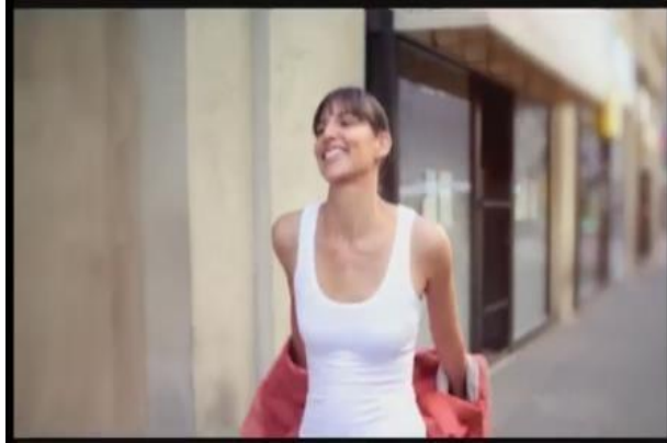
Gambar 12. Tokoh tampak gembira (Dove, menit 00:23)

Dampak lebih jauh lagi ditampilkan oleh iklan produk Pond's. Berkat wajah yang putih bersih, tokoh tidak hanya memiliki rasa percaya diri. Namun lebih dari itu, kecantikan kulit wajahnya menarik perhatian lawan jenis hingga mempertemukannya dengan pasangan hidupnya, seperti tampak dalam screenshot berikut: