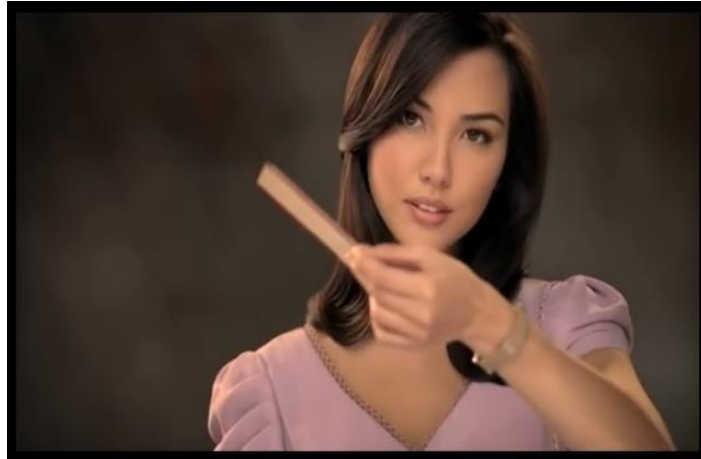
Gambar 2. Model (Pond's, menit 00:04)

Wajah tokoh dalam kedua iklan tersebut menunjukkan karakteristik wajah Asia, meskipun lebih cenderung pada wajah Pan Asia, yaitu campuran antara ras Asia dan ras lainnya, biasanya Kaukasia (kulit putih). Karakteristik Asia tersebut terlihat pada warna bola mata yang kecoklatan, rambut coklat tua, dan bentuk mata yang tidak terlalu lebar. Adapun darah campuran terlihat dari struktur tulang tubuh maupun wajah, dan terutama dari warna kulit yang putih bersih.